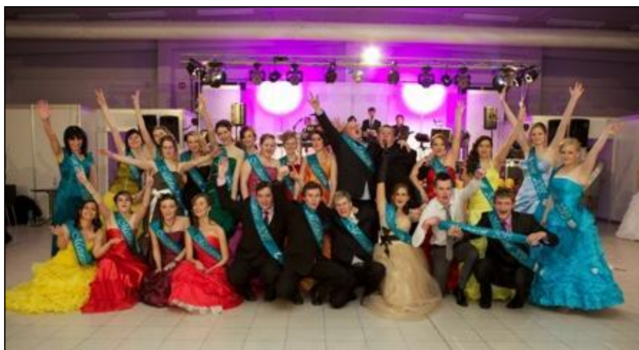
Třída 4. A

Klub Obchodní akademie v Lysé nad Labem , občanské sdružení, uspořádal maturitní ples 4. ročníku na Výstavišti v Lysé nad Labem. Ples byl už jako tradičně velmi úspěšný.