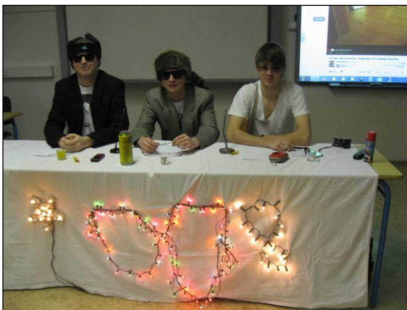
Žáci 4. B