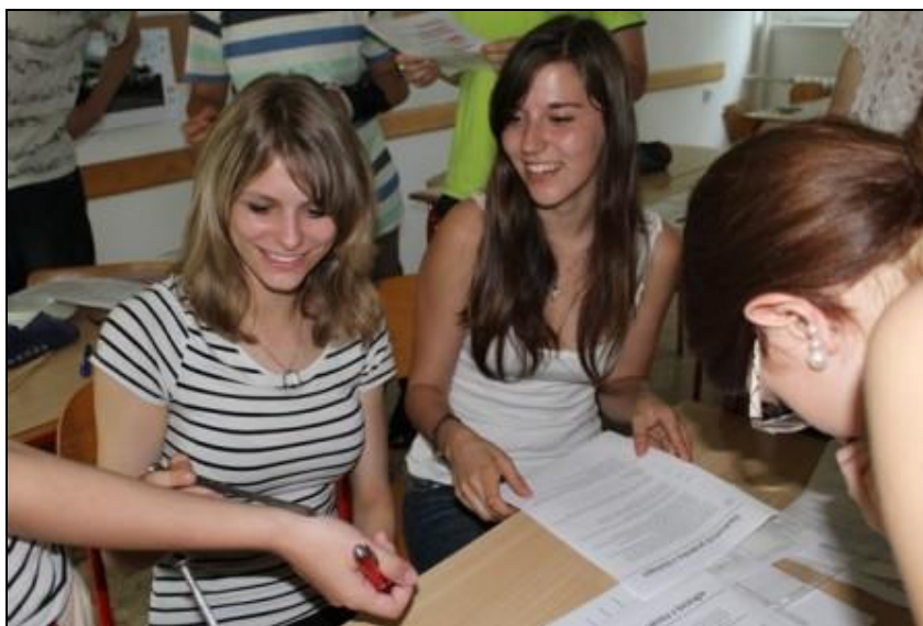
Žáci při přírodovědných praktikách