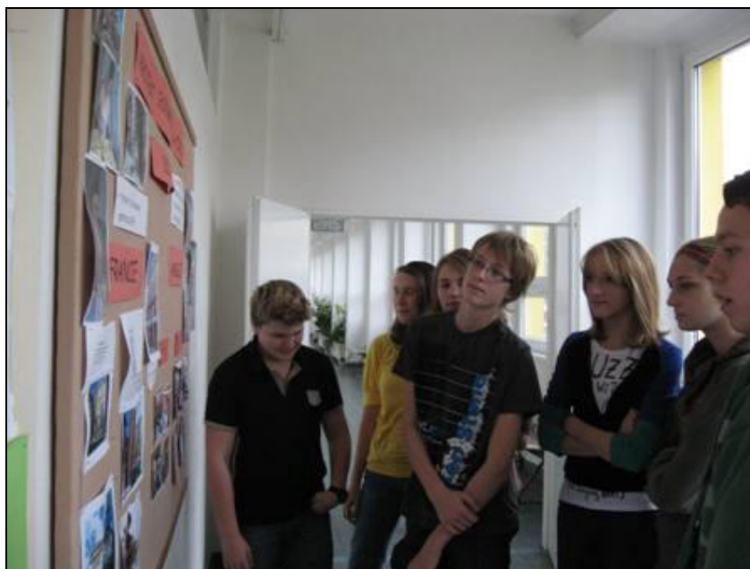
Žáci ZŠ u nás ve škole

Škola uspořádala tři Dny otevřených dveří , z toho jeden v sobotu a druhé dva v pracovní dny, aby uchazeči a jejich rodiče mohli nahlédnout i do výuky.