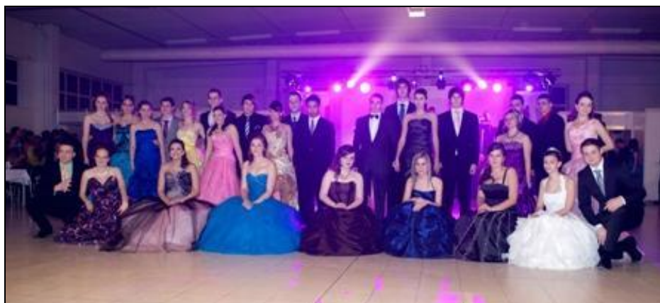
Třída - 4.B