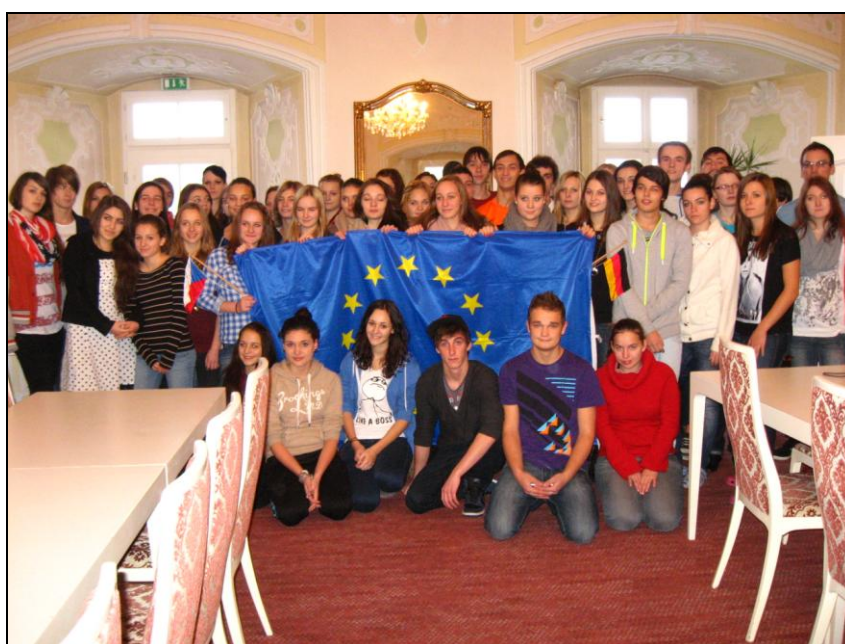
Žáci naší školy a Maria Ward Gymnasia Bamberg

Účastníci simulační hry v Lichtenfelsu v roce 2012