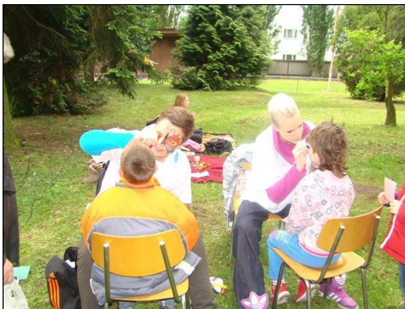
Dětský den v Lysé n. L.

Žákyně 1. a 2. ročníku vzorně reprezentovaly naši školu na dětském odpoledni, které se konalo v sobotu 25. 5. 2013 při příležitosti oslav Mezinárodního dne dětí v Lysé nad Labem. I přes nepříznivé počasí studentky potěšily přítomné děti malbami na obličej i zajímavými soutěžemi – poznáváním předmětů poslepu a řešením hádanek.