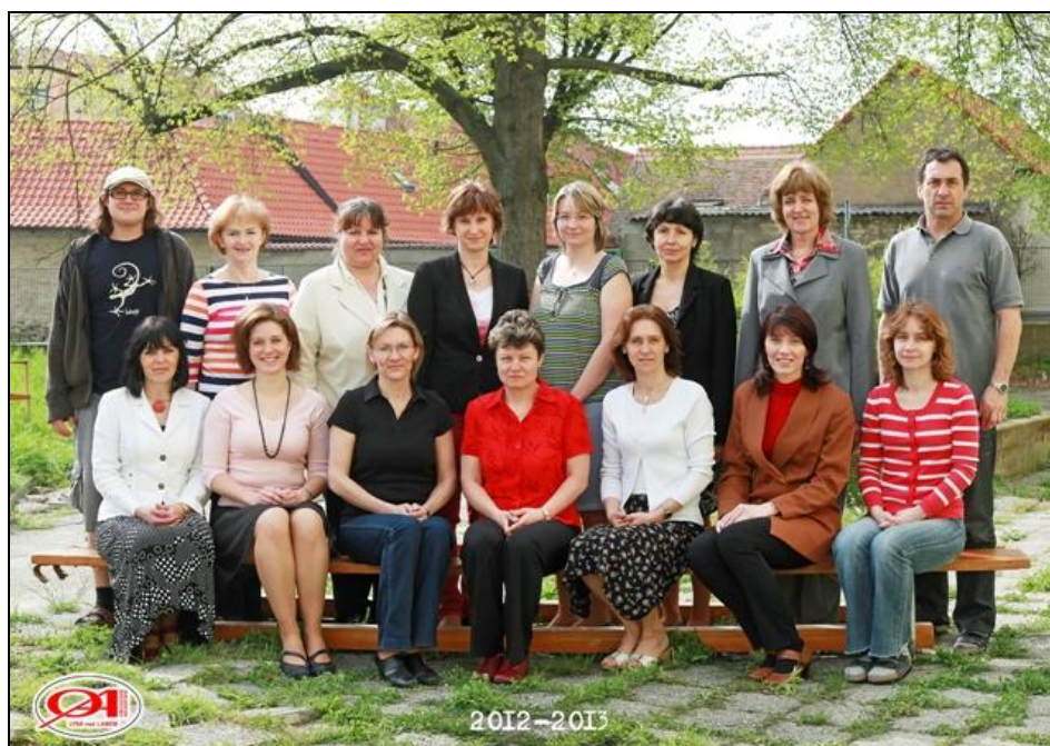
Učitelé a pracovníci správy školy

1 všechny formy vzdělávání; 2 denní forma vzdělávání (denní studium)