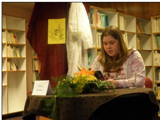
Studentka 2. ročníku