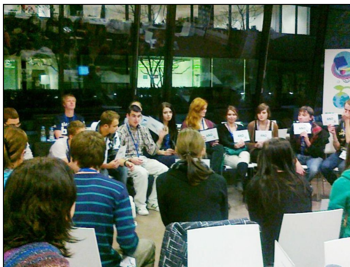
Žáci v centrále společnosti Telefónica