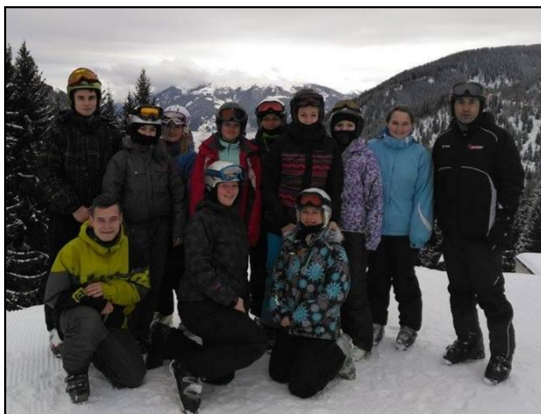
Lyžařský kurz 2016

Skupina studentů naší školy vyjela ve dnech 14. 2. - 19. 2. 2016 na výběrový lyžařský kurz do Seebodenu v jižním Rakousku. Lyžovali jsme a snowboardovali v areálu Goldeck ve Vysokých Taurech.