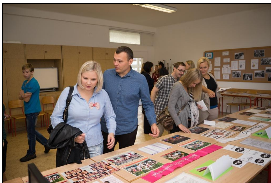
Absolventi na oslavách 20. výročí OA Lysá n. L.