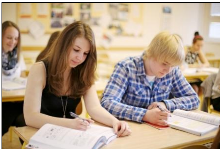
Žáci 1. ročníku

Při škole nepracují zájmové kroužky. Daří se nám motivovat žáky, aby se ve volném čase zúčastnili akcí v Lysé n. L. Žáci prezentovali aktivity školy na burzách středních škol a během dnů otevřených dveří u nás ve škole. Zúčastnili se také veletrhu středních škol, který pořádala Krajská hospodářská komora Střední Čechy na Výstavišti v Lysé nad Labem v únoru 2016. Aktivity naší školy a možnosti uplatnění absolventa prezentovali pomocí vystoupení, které mělo velký úspěch, a ve výstavním stánku školy. Žáci naší školy navštívili svoje základní školy, podělili se tam o zkušenosti se studiem u nás a předali propagační materiály.