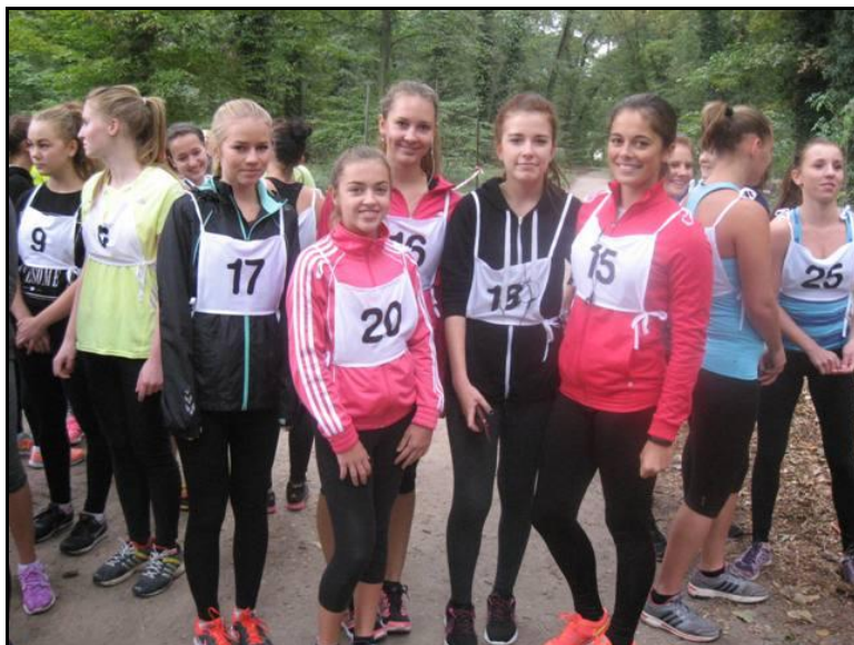
Družstvo dívek OA Lysá n. L.

Již tradičně naše škola pořádala Okresní kolo v přespolním běhu středních škol. Závod se každoročně koná v zámeckém parku v Lysé nad Labem. Letos se družstvo chlapců umístilo na 5. místě a družstvo dívek na 3. místě.