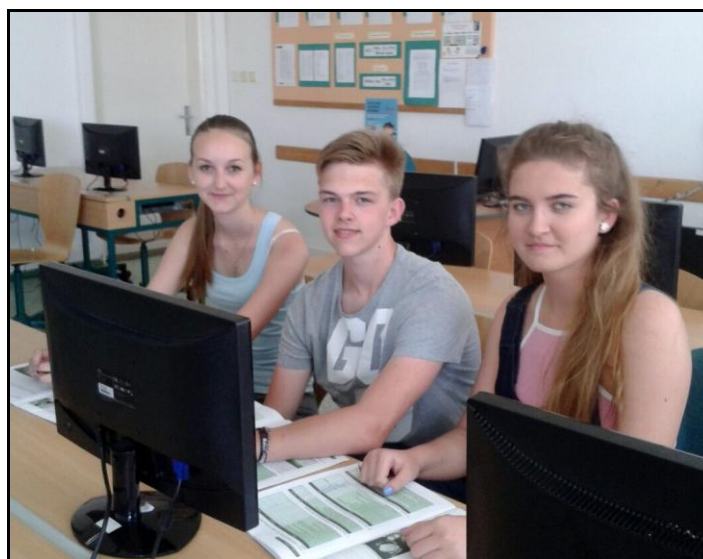
Nejlepší řešitelé manažerské olympiády