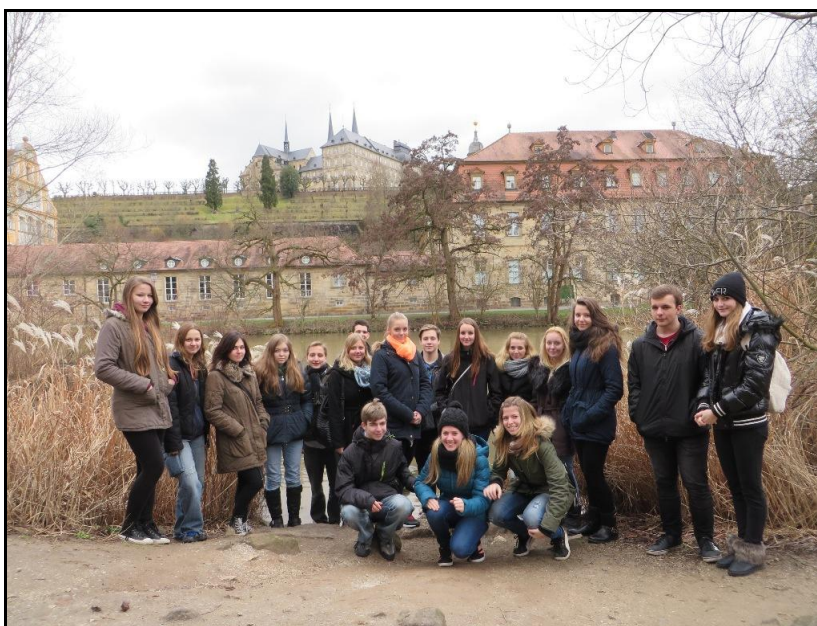
Žáci školy v německém Bamberku

Zahraniční aktivity školy přinášejí zvýšený zájem žáků o studium cizích jazyků. Každoročně naši absolventi nastupují studovat cizí jazyky na VŠ, odjíždějí pracovat do zahraničí nebo pracují ve firmách se zahraniční účastí. Spolupráce se zahraničními školami má pozitivní vliv na zvyšování zájmu o studium na naší škole. Zahraniční aktivity dále zlepšují jazykovou vybavenost učitelů cizích jazyků a působí jako motivační prvek v jejich dalším profesním rozvoji i jako nefinanční forma odměny.