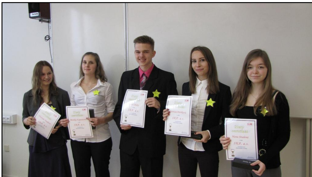
Vítězné družstvo v ekonomickém projektu 2016