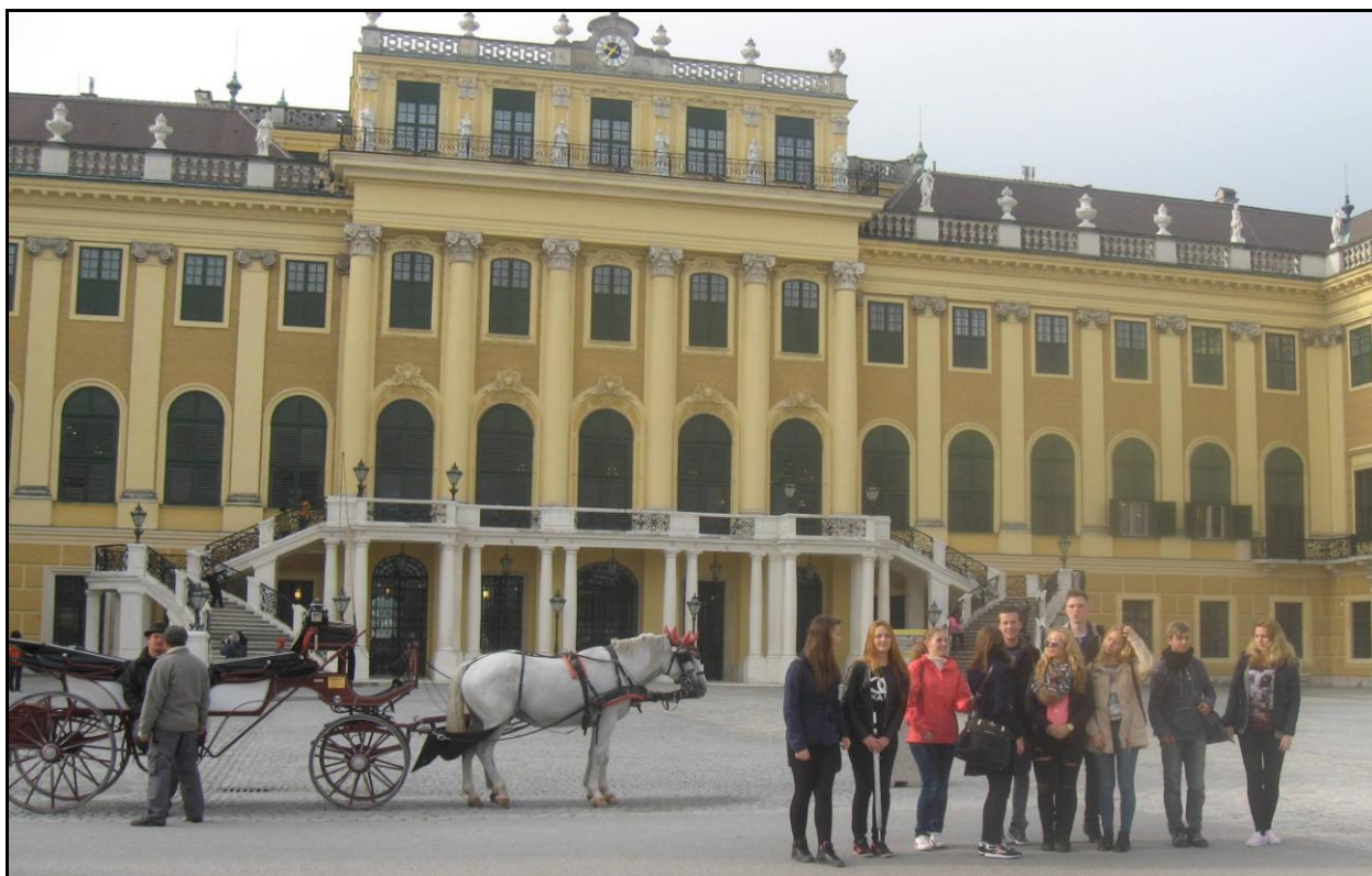
Studenti OA Lysá n. L. ve Vídni

V týdnu od 5. 10. do 9. 10. 2015 absolvovalo 10 žáků školy v doprovodu učitelky německého jazyka jazykově poznávací pobyt ve Vídni.