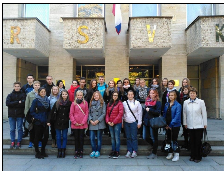
Ruské středisko vědy a kultury

V rámci školního projektu Den jazyků, který každoročně připravujeme, letos žáci navštívili Goethe Institut a Ruské středisko vědy a kultury v Praze. Učitelé anglického jazyka připravili pro studenty komentovanou prohlídku vybraných pražských památek v anglickém jazyce.