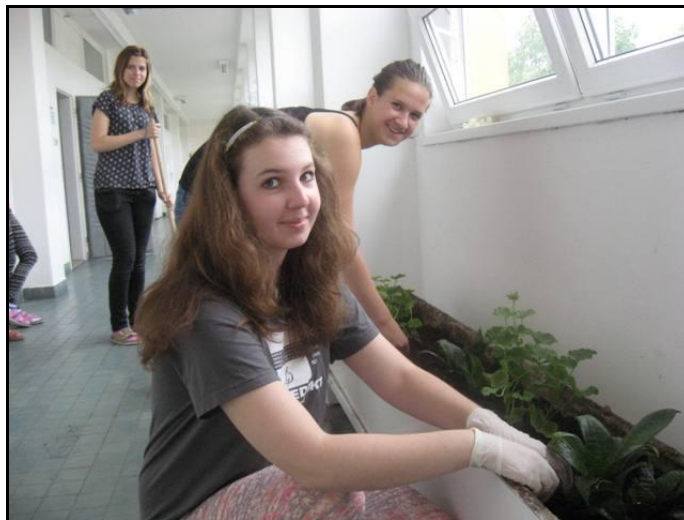
Žáci 1. ročníku

V rámci EVVO projektu žáci 1. ročníku provedli úpravu květinové výzdoby školy a blíže se seznámili s tříděním odpadu ve škole.