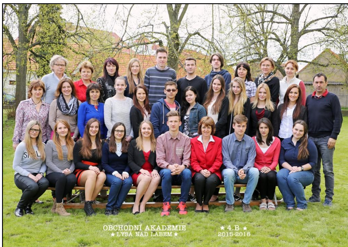
Učitelé a žáci 4. ročníku

Poznámka: 1 všechny formy vzdělávání; 2 denní forma vzdělávání (denní studium)