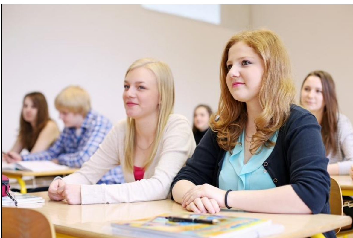
Žáci 1. ročníku

Žáci jsou ze Středočeského kraje, jeden má trvalé bydliště v Praze.