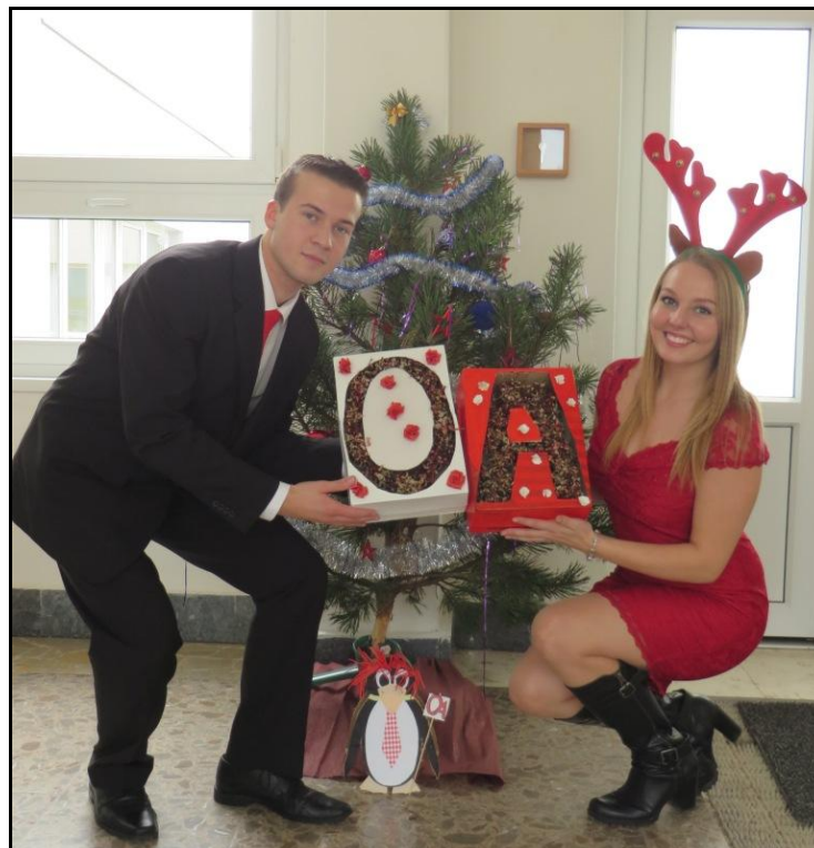
Žáci 4. ročníku

připravili již tradičně žáci 4. ročníků. Navodil příjemnou vánoční atmosféru a napomohl k poznání žáků napříč ročníky.