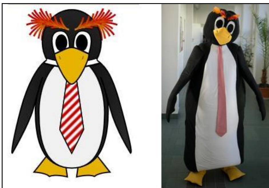
Maskot školy - tučňák