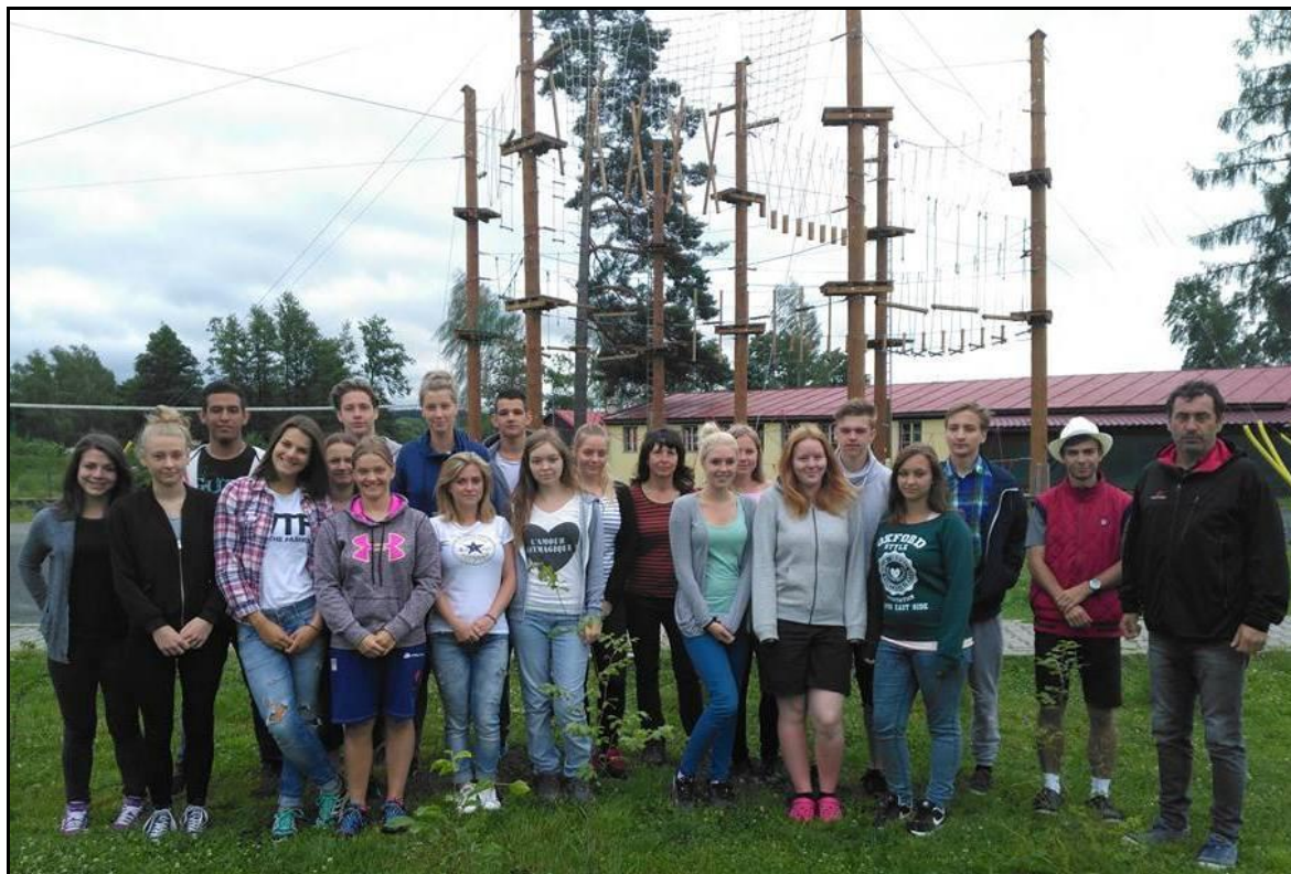
Žáci 3. ročníku

Sportovní kurz pro žáky 3. ročníku se konal již tradičně v rekreačním středisku U Starého rybníka ve Zbraslavicích.