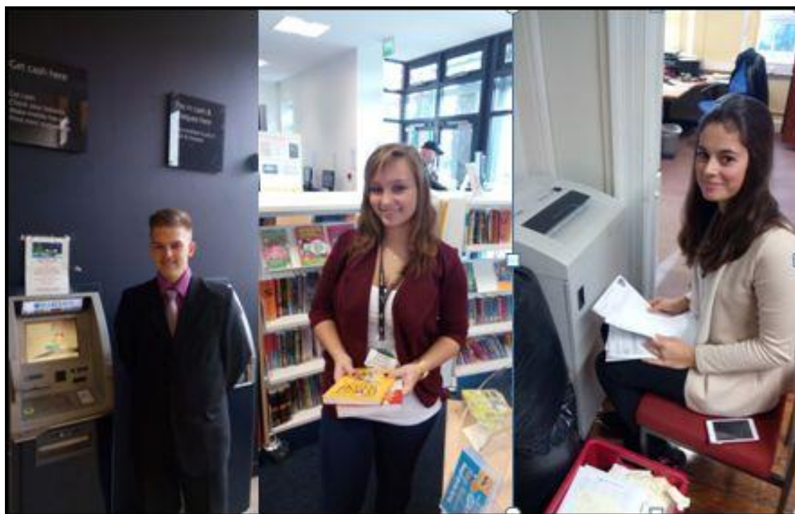
Žáci na praxi v Anglii v roce 2015