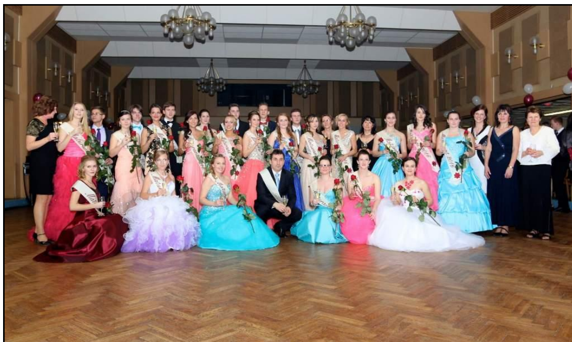
Žáci 4. ročníku a učitelé školy

Žáci 4. ročníku připravili maturitní ples. Konal se v Kulturním domě v Čelákovících.