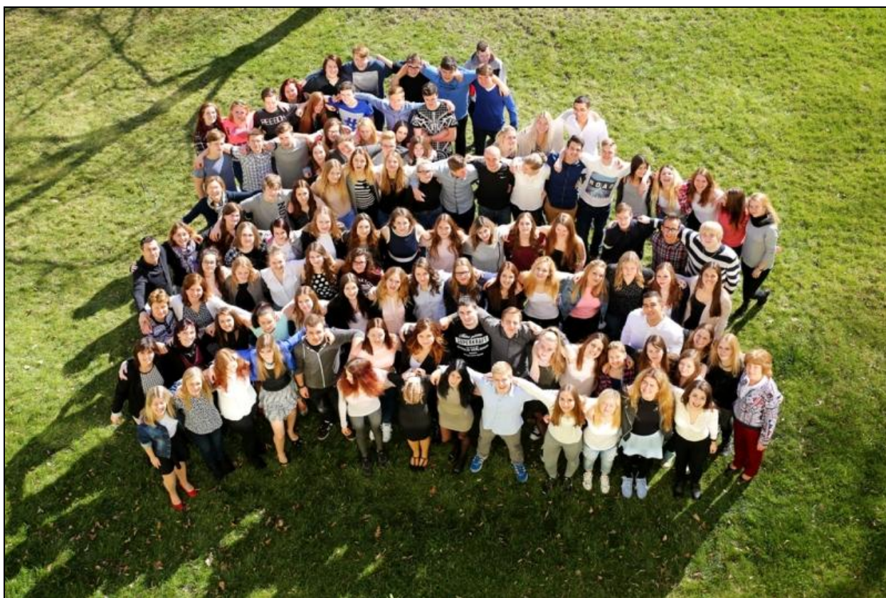
Žáci a učitelé školy