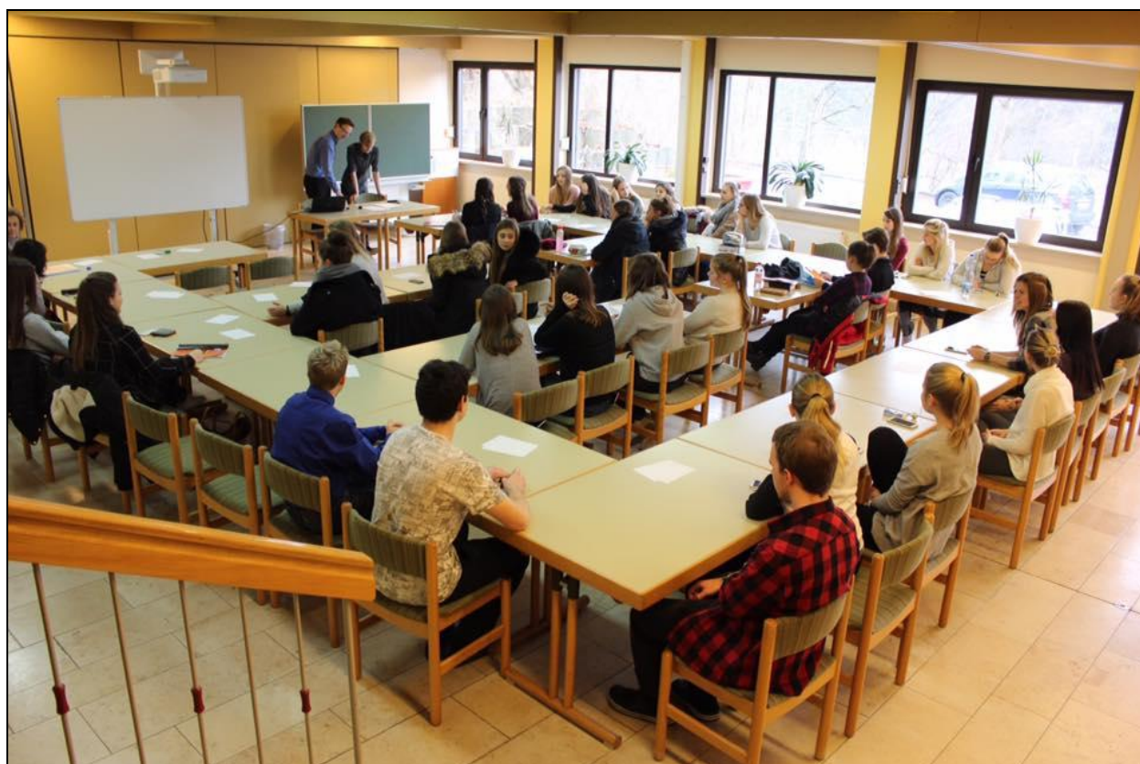
Setkání našich žáků s žáky Maria Ward Gymnasia v Schloss Schney u Lichtenfelsu

Více informací o výjezdech je v kapitole č. 15 této výroční zprávy.