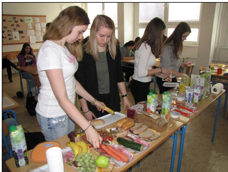
Žáci 3. ročníku připravují zdravou snídani