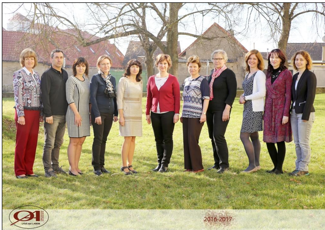
Učitelé Obchodní akademie Lysá n. L.