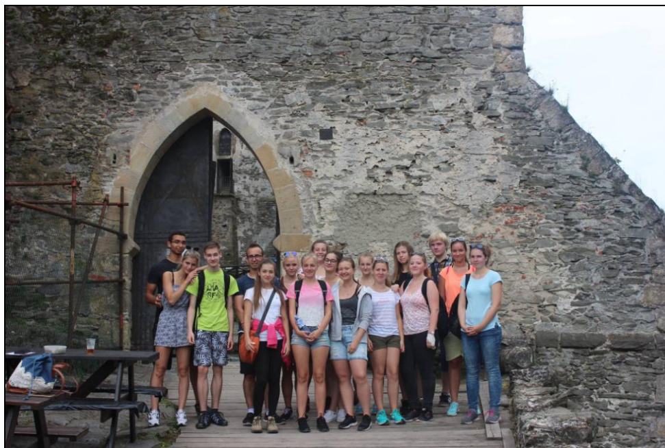
Žáci 2. ročníku na hradu Bezděz

Ve dnech 27. – 28. června jsme se žáky podnikli již tradiční akce. Exkurzi do Máchova kraje (2. a 3. ročníky), do Prahy za gotickou a barokní architekturou (1. ročníky) nebo návštěvu IQLANDIE v Liberci (1. a 2. ročníky).