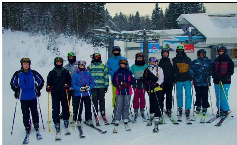
Lyžařský kurz 2017