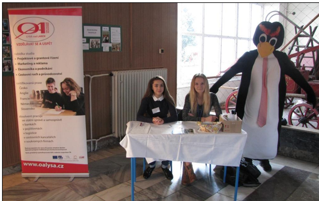
Den otevřených dveří 12. 10. 2016

I v letošním roce se nepříznivě projevil gravitační vliv Prahy. Na druhé straně k nám přicházejí studovat žáci i z míst vzdálenějších od Lysé n. L., např. z Městce Králové. Většina uchazečů volí naši školu na základě doporučení absolventů naší školy, což svědčí o dobré pedagogické práci a atmosféře ve škole.