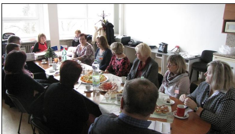
Setkání zástupců OA Středočeského kraje

V tomto školním roce jsme ukončili pětileté období udržitelnosti projektu „Modernizace školních kurikulárních dokumentů obchodních akademií zřizovaných Středočeským krajem – metodicko-materiální zajištění“ Registrační číslo projektu: CZ.1.07/1.1.06/01.0063, který jsme realizovali v letech 2009 – 2011. Uskutečnili jsme závěrečné setkání zástupců všech partnerských obchodních akademií. Zhodnotili jsme výsledky partnerství a plánovali další společné aktivity.