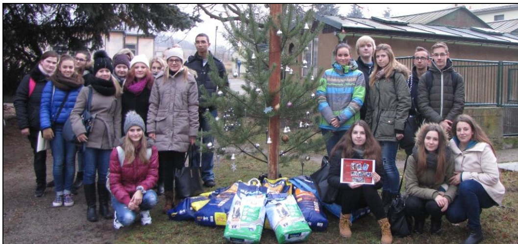
Žáci 2. A v útulku v Lysé n. L.