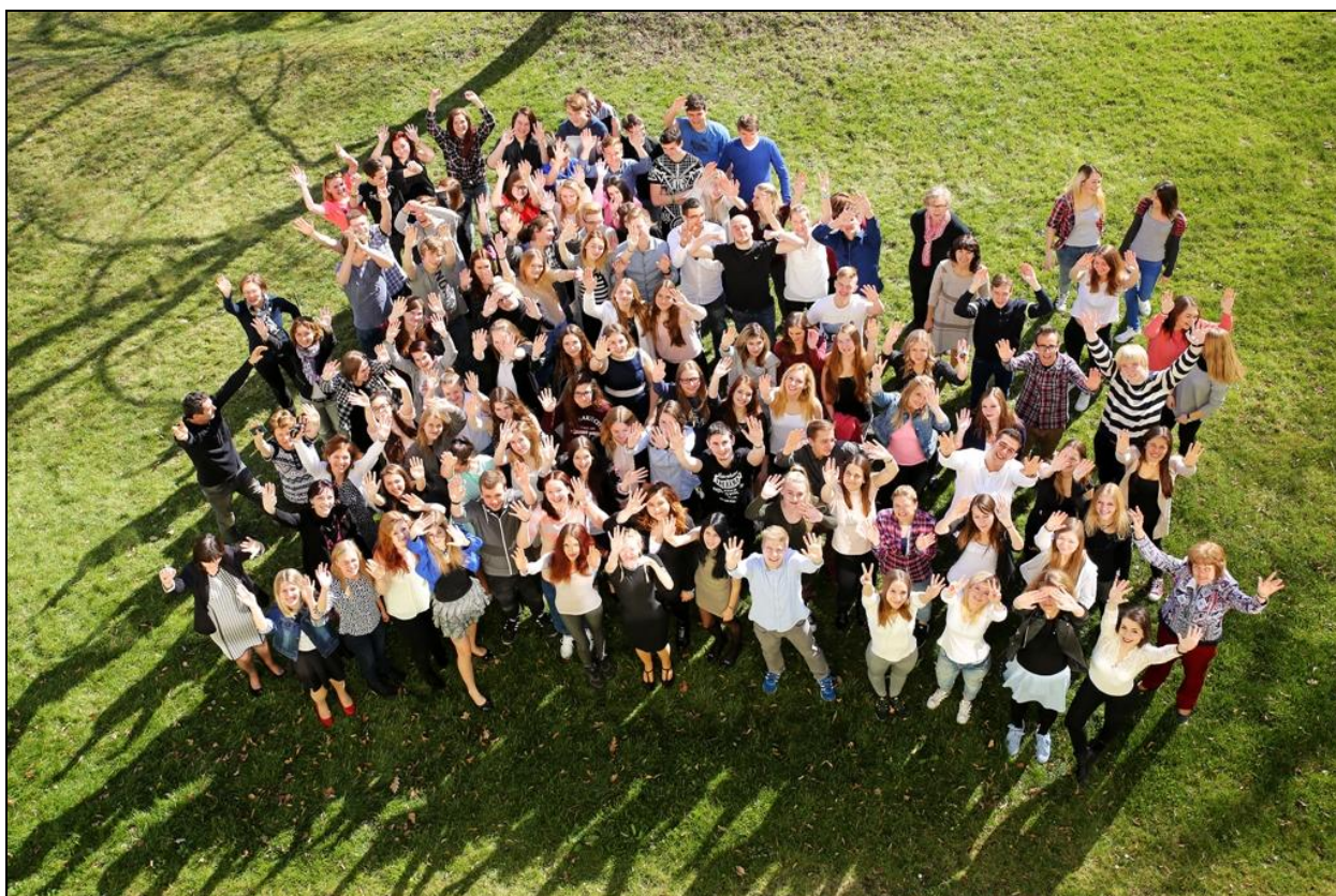
Žáci a učitelé školy

Na další vzdělávání pedagogických pracovníků ve školním roce 2016/2017 byla vynaložena finanční částka ve výši 6 690,- Kč.