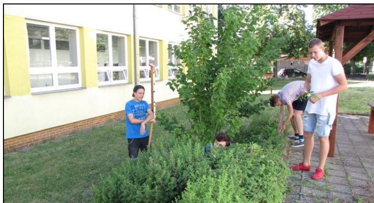
Žáci 1. ročníku - EVVO projekt