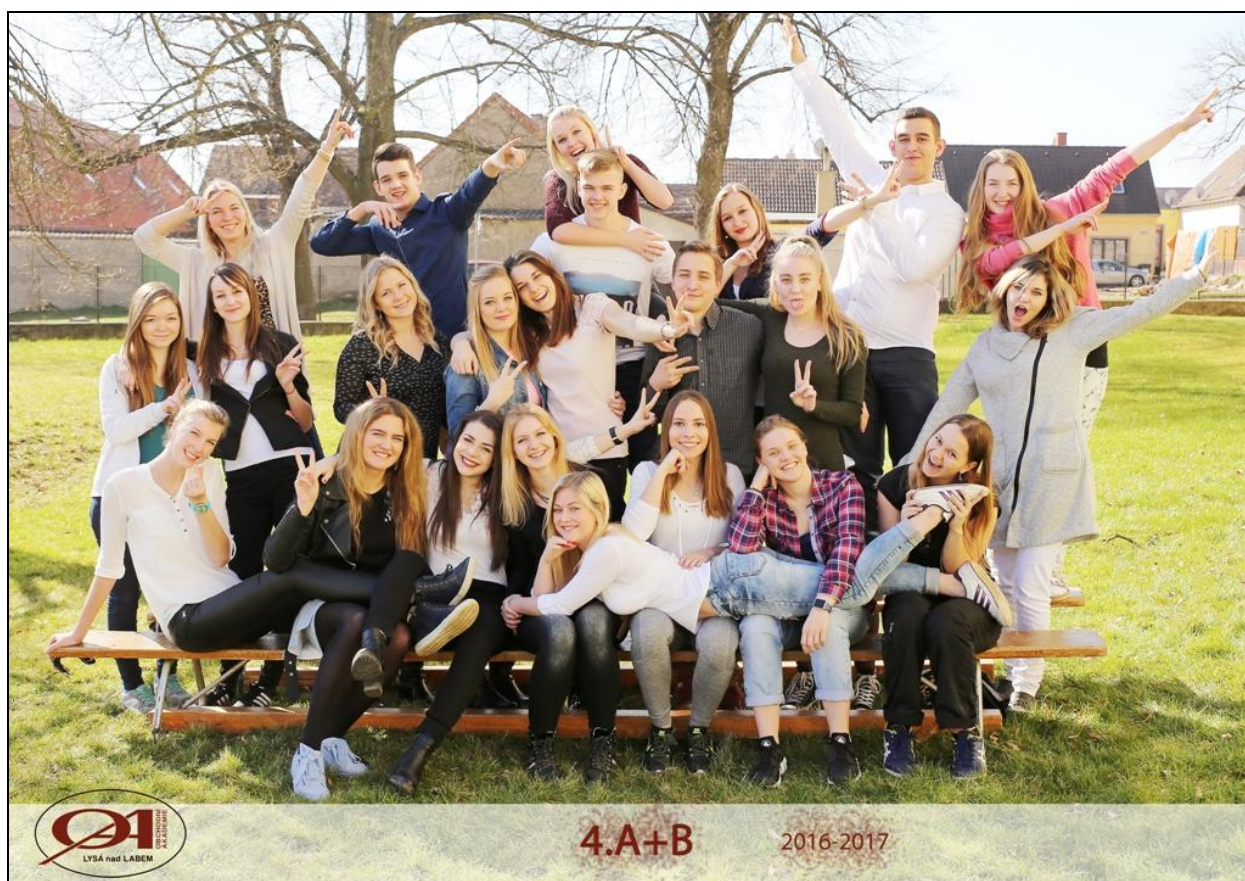
Žáci 4. ročníku OA Lysá n. L.

Poznámka: 1 všechny formy vzdělávání; 2 denní forma vzdělávání (denní studium)