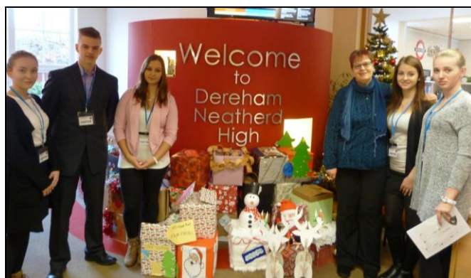
Žáci na praxi v Anglii v roce 2016

Již tradičně jsme připravili odbornou praxi v kancelářích v Derehamu ve spolupráci s partnerskou školou Dereham Community High School, Dereham, Norfolk, Velká Británie. Absolventi napsali reportáž, kterou si můžete přečíst na www.oalysa.cz . http://oalysa.cz/novinky.php?ms=5&Id=262