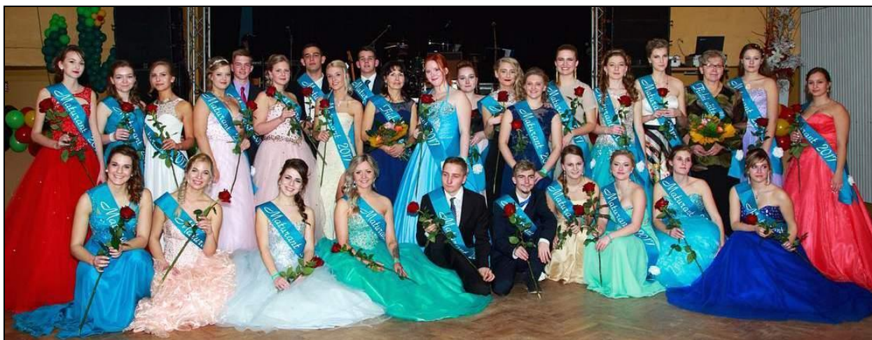
Maturitní ples 4. A a 4. B

Žáci 4. ročníku připravili maturitní ples. Konal se v Kulturním domě v Čelákovících.