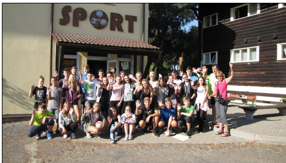
Žáci 1. A na seznamovacím kurzu