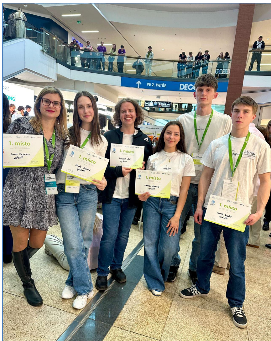
Firma Upglass vítězí