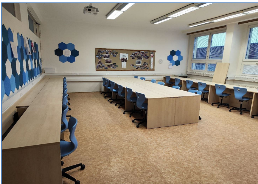
Multimediální učebna 106