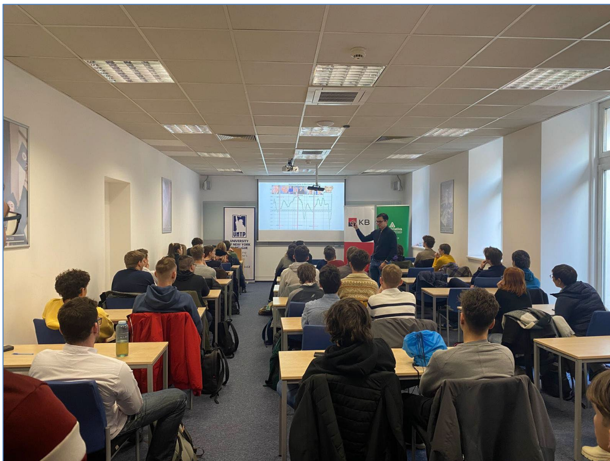
Krajské kolo INEV Ekonomické olympiády