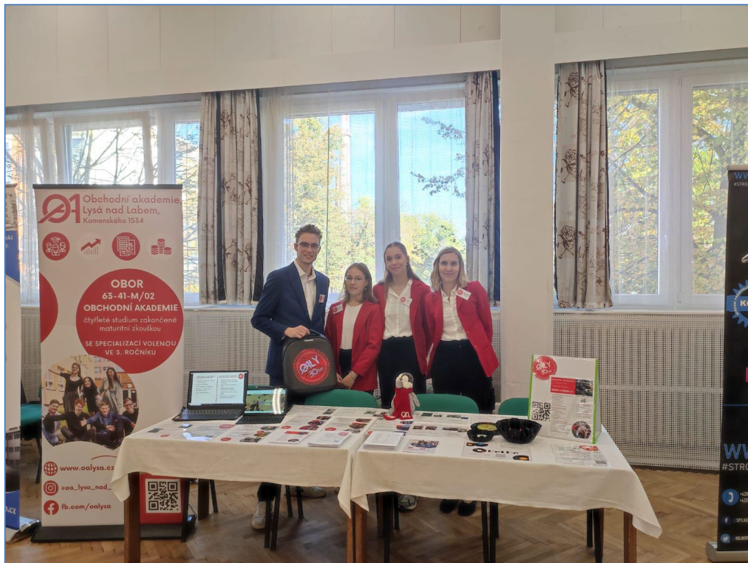
Burza škol Mělník