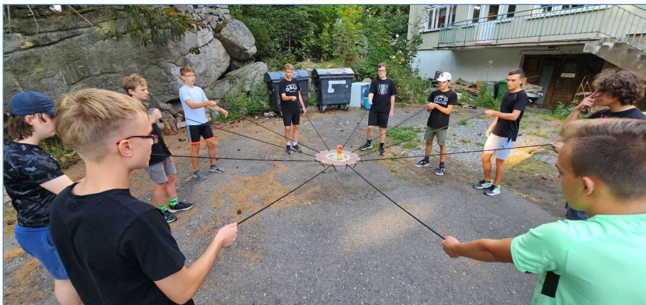
Adaptační kurz 2024/2025