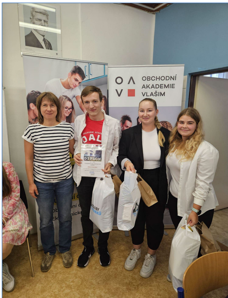
Výherci krajské soutěže EKOTÝM 2024