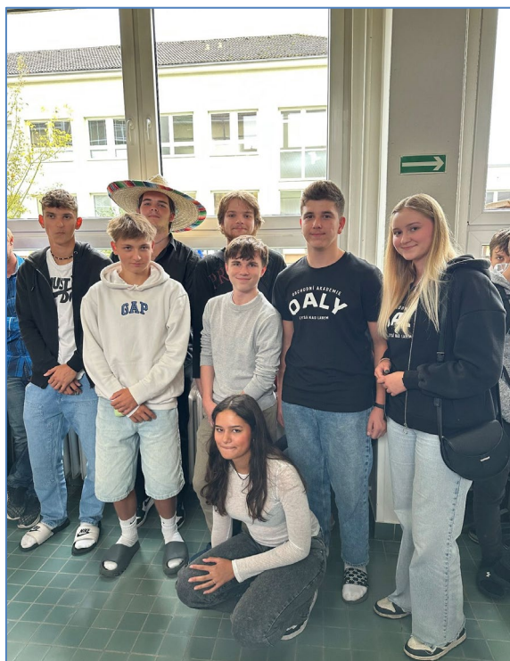
Výherci Evropského dne jazyků