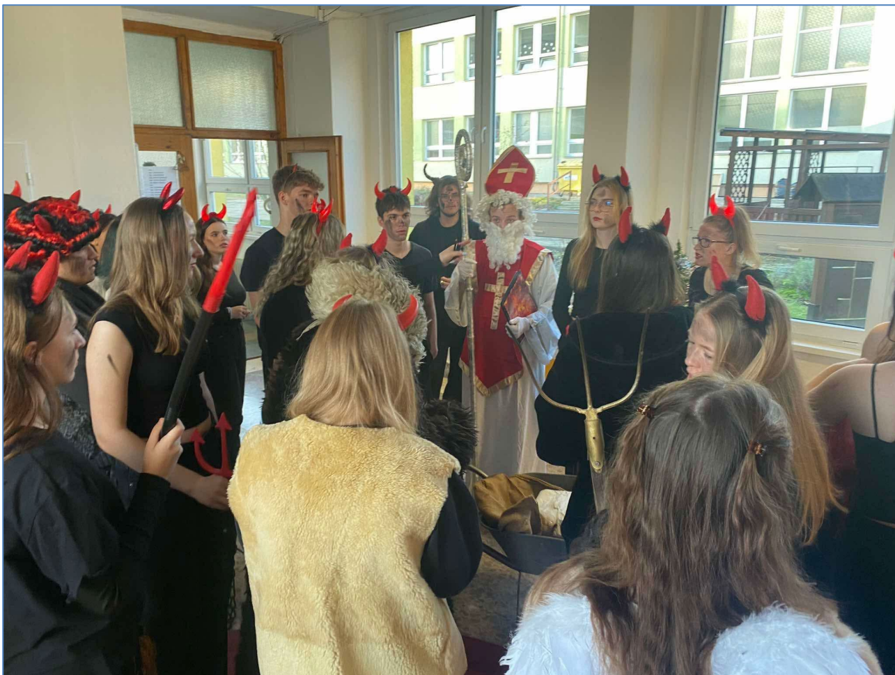
Čertovské rojení na OA