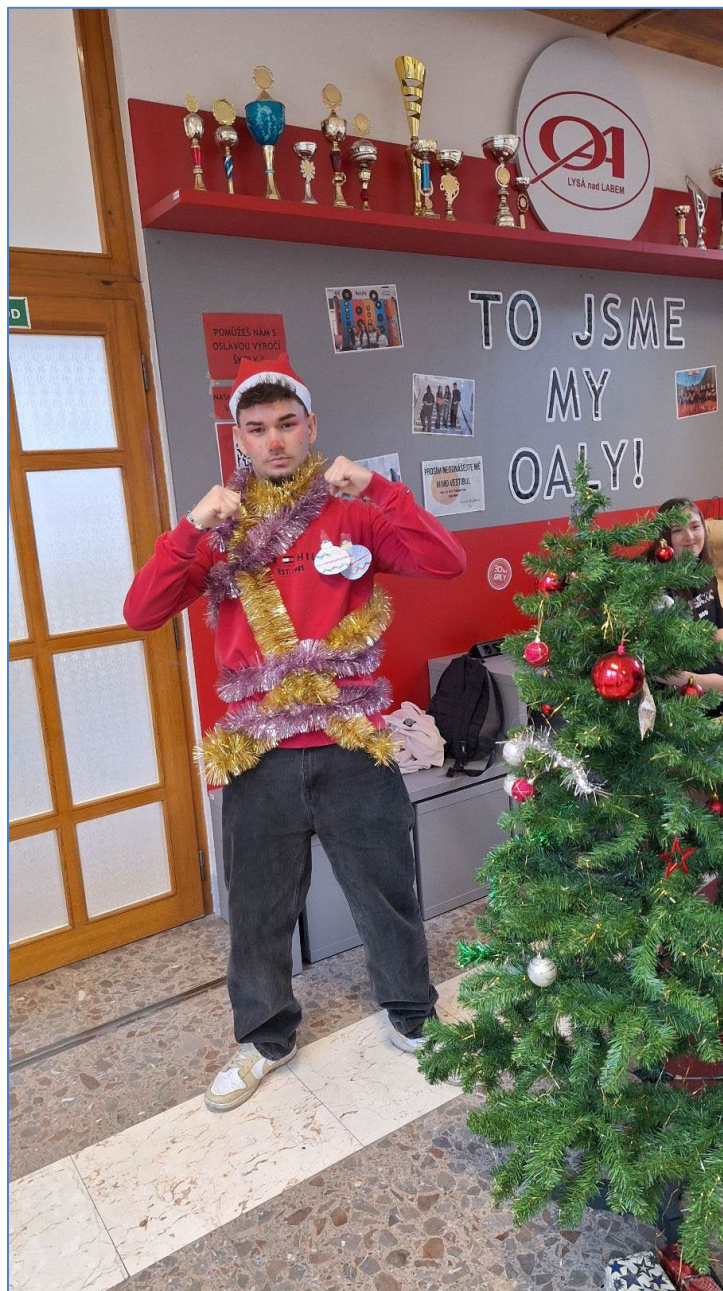
Vánoce, Vánoce přicházejí