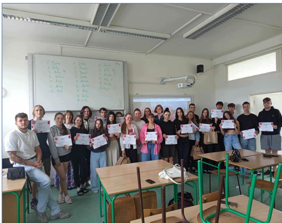
Žáci třetích ročníků po předání certifikátů