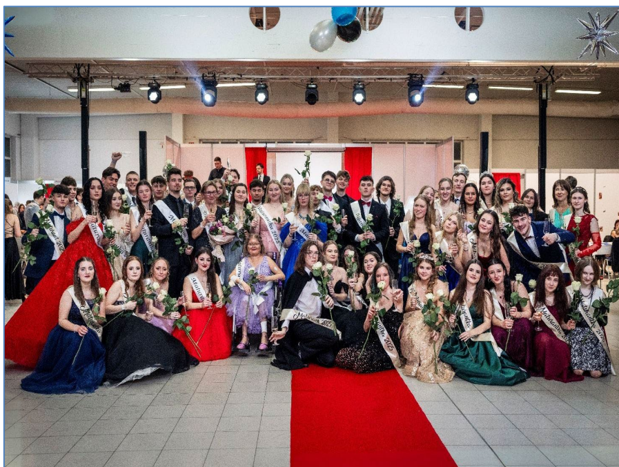
Maturitní ples 4. A, 4. B