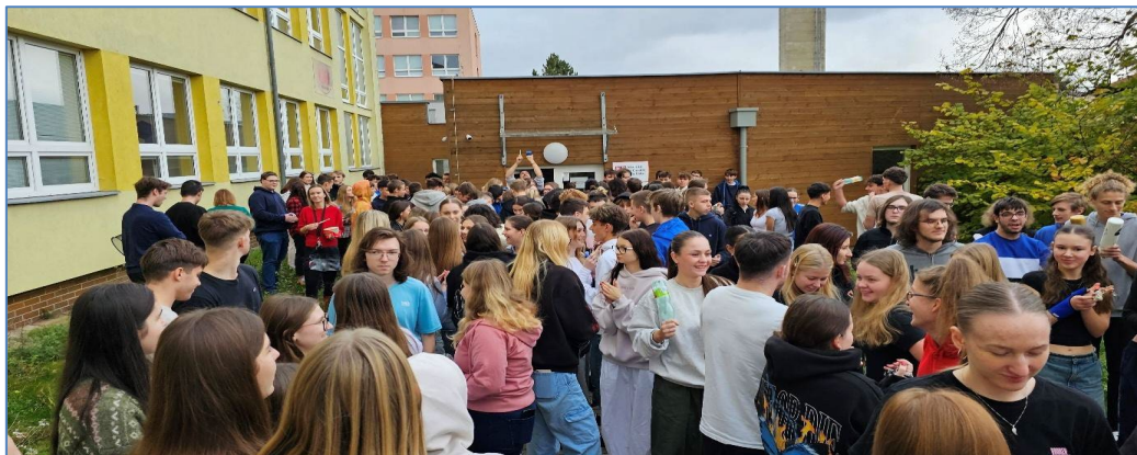
Bubnujeme proti násilí na dětech

Škola se zapojila do akce Centra LOCIKA, kterou centrum upozorňuje na důležitost ochrany dětí před násilím v rodině. Bubnováním jsme symbolicky dávali hlas týraným dětem. Ty jsou často pro společnost neviditelné.