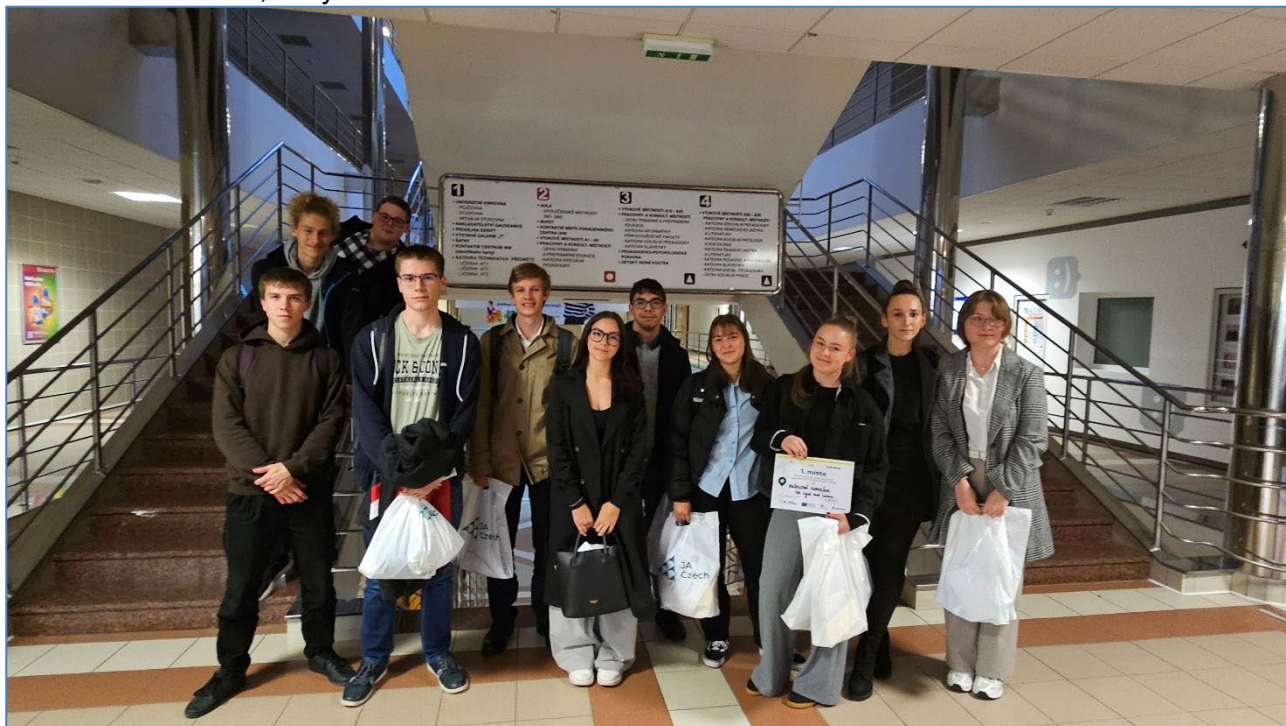
Účastníci inovačního kempu Re-power your future