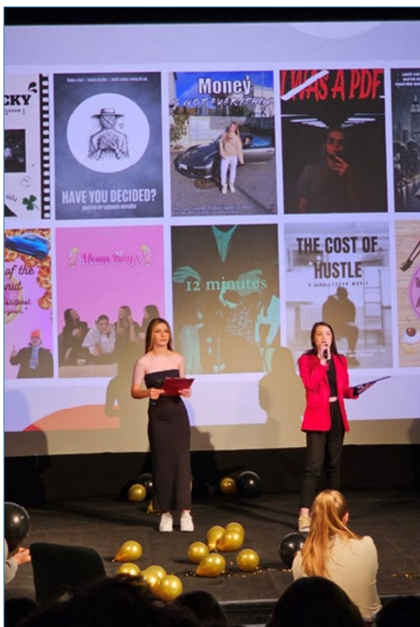
Promítání žákovských filmů