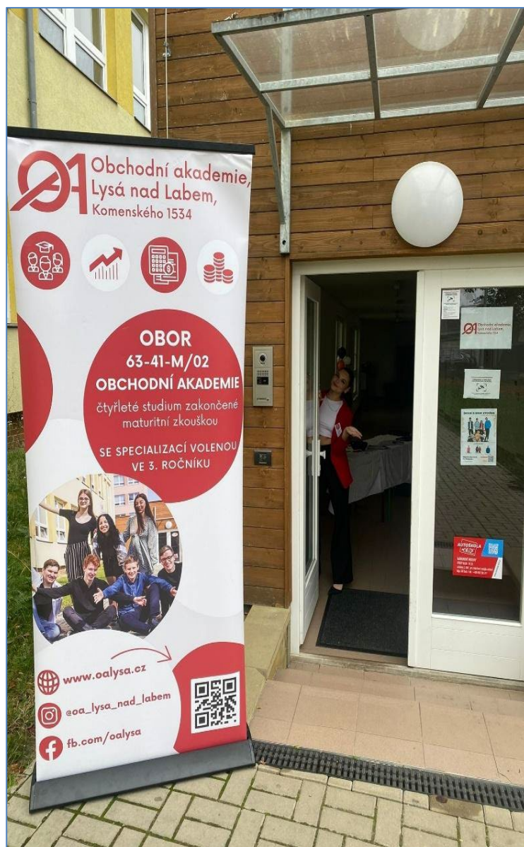
Den otevřených dveří na OA