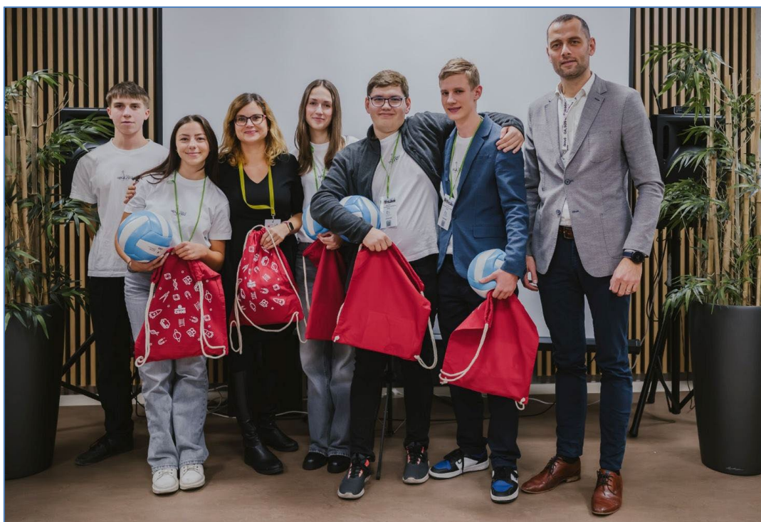
Firma Upglass v Hradci Králové