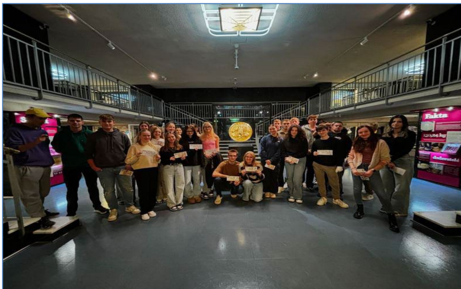
Návštěva ČNB v Praze